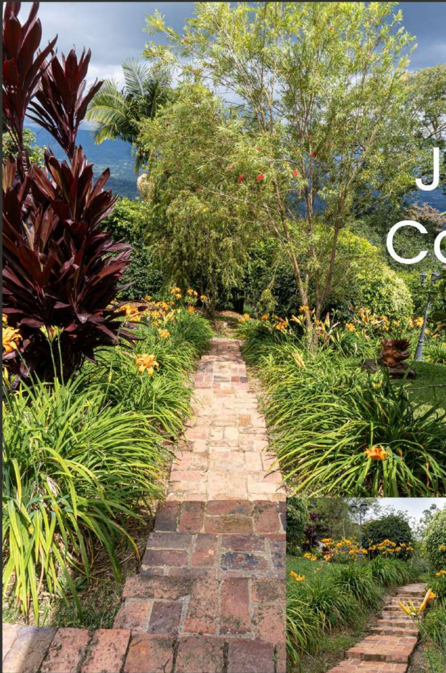
Quinta La Cartuja

Jardines exuberantes y árboles frutales abundantes se funden en un oasis natural. La belleza y la frescura te envuelven en cada rincón.